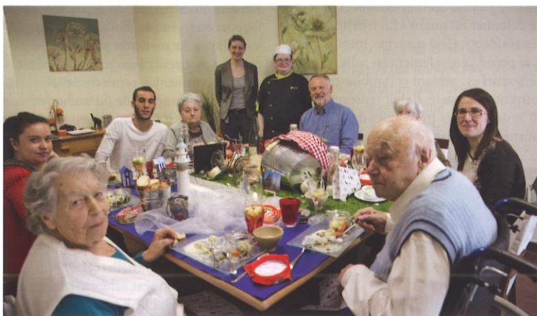
L'EHPAD La Maison de l'Amandier de Saint-Marcel (71) - Adef Résidences.

dans des projets de développement durable ou d'amélioration des produits ou services proposés aux résidents. Ils ont dès lors un impact direct sur la lutte contre la dénutrition. "Maison Gourmande et Responsable" propose ainsi une réponse globale en faisant de la RSE une source d'efficacité, d'innovation et de performance. Il semble de toutes façons clair qu'une telle démarche produit des bénéfices connexes : environnementaux d'abord par la protection des ressources naturelles, la réduction des pollutions diverses (déchets, pesticides, gaz à effet de serre) ; sociétaux ensuite par l'accès à une alimentation de qualité, la lutte contre la surconsommation ou l'éducation à